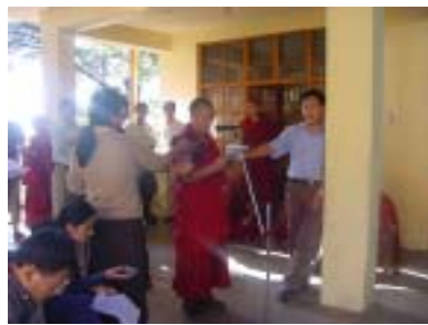
ནས་ར་སྤྱི་ར་འཇུག་ བཀོད་ལྱིས་བོད་རྒྱལ་ ཁབ་ཚེན་པོའི་རྒྱལ་སྤྱི་ ངམ་བརྗོད་ལྷན་པའི་སྟོ་ རས་སྤངས། དུས་དྲན་