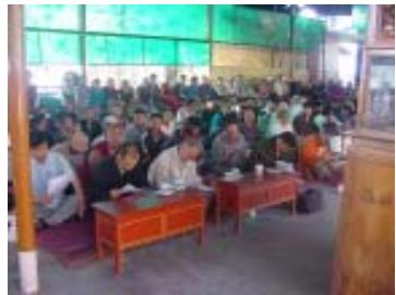
སྤྱི་ལོ་ ༡༠༠༥ ཟླ་ ༧ ཚེས་ ༡༧ ཉིན་བཞུགས་ ལྟར་ལྷ་རྒྱལ་རི་ར་ཟབ་ རྒྱས་ངང་འཚོགས་པ་མ་

༡༣༡། །འདི་ལོའི་དགུ་པའི་ཉིན་བདུན་གྱི་དུས་དྲན་དེ་བཞིན་