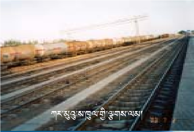
ཀར་ལྷུང་ས་ཁུང་གི་ལྷགས་ལམ།

ང་ཚོས་དོགས་གཞི་བྱེད་དཔོན་པ་གཅིག་ཞི་ད་ རིས་ཀྱི་འགྲུལ་མིའི་ཁོངས་སུ་བོད་མི་སྤོགས་ལའང་སྤུ་སེ་ སྐོན་གྱི་མེད་སྐོར་འདུག དེའི་ཆེད་མངགས་ལུལ་སྐོར་